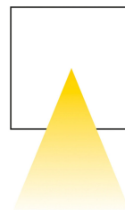
fascio singolo single beam