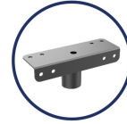
Accessorio testa per palo / Pole adaptor