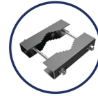
Accessorio morsa per palo / Clamp bracket